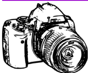
PHOTO AND LIVE Di Andrea Liverani Studio Fotografico www.photoandlive.it Via Emilia 287— 40026 Imola Cell. 348/2690044

SCONTO DEL 20% SULL'ACQUISTO DI OCCHIALI DA VISTA COMPLETI DI LENTI O SOLO IL CAMBIO LENTI CON TUTTI I TRATTAMENTI RICHIESTI; SCONTO DEL 10% SULL'ACQUISTO DI LIQUIDI PER LA MANUTENZIONE DELLE LENTI A CONTATTO O OCCHIALI DA SOLE.