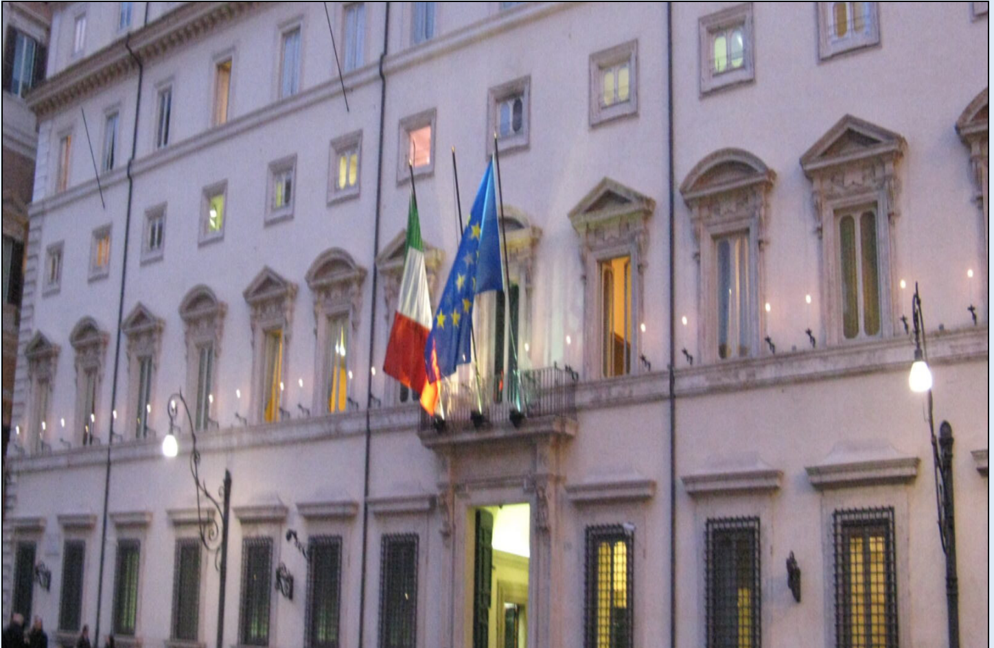
Palazzo Chigi – Sede del Governo

a risolvere questa iniqua situazione, in sede di attuazione della legge delega per la riforma fiscale» si legge nella lettera firmata dai segretari generali e dal direttore generale di Abi.